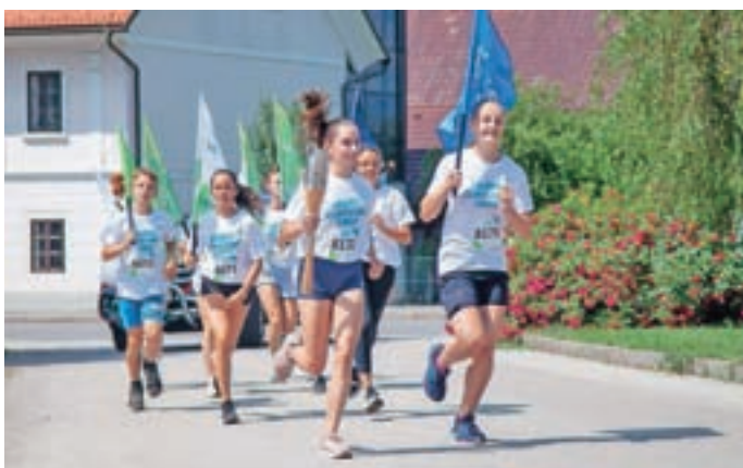
Zadnji del teka štafete z baklo skozi Cerklje

lesovo, Ženskega nogometnega kluba Cerklje, Rokometnega kluba Cerklje, predstavniki in učenci Osnovne šole Davorina Jenka Cerklje, otroci Vrtca Murenčki, člani Društva upokojenec Cerklje in Športnega društva Lipa Cerklje.