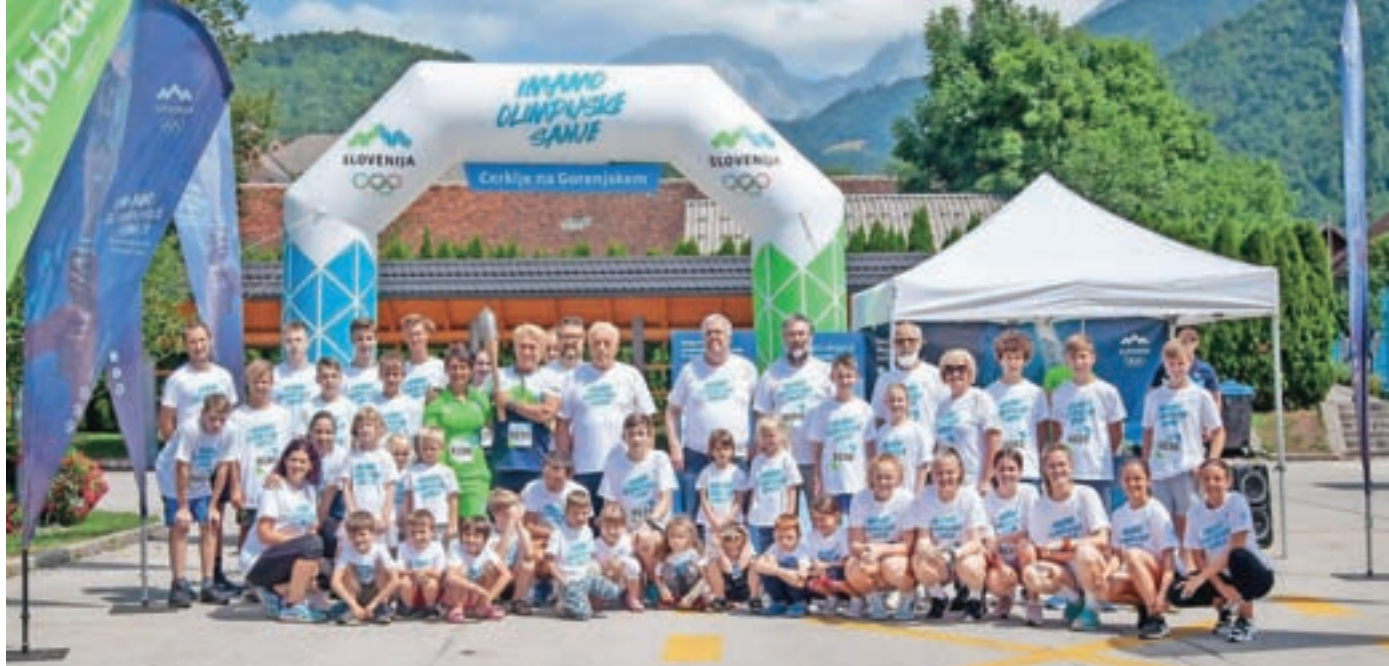
Skupinska fotografija udeležencev