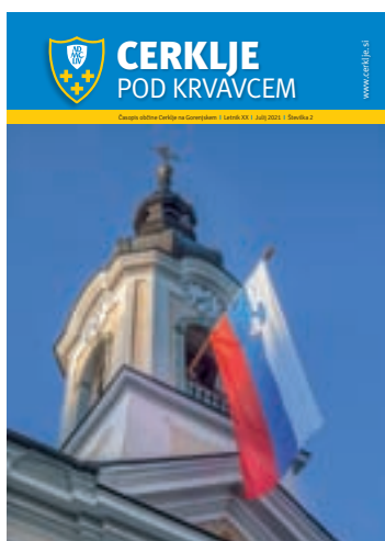
Slovenska zastava na zvoniku adergaške cerkve ob dnevu državnosti