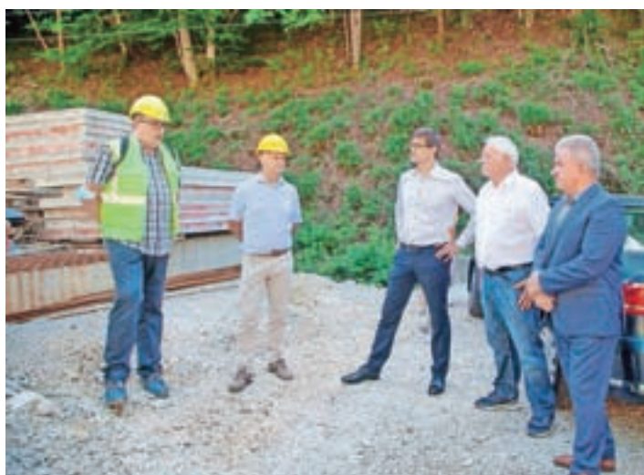
Minister Vizjak (prvi z desne) na ogledu gradnje krvavškega vodovoda

Trenutno je zgrajenih okoli sedemdeset odstotkov vodovodnega omrežja, poteka gradnja ultrafiltracijskega sistema, nato pa sledi še zahtevna gradnja vodohrana v bližini Doma Taber. Vrednost investicije znaša blizu 12 milijonov evrov (brez DDV) sodelujoče občine pa so za projekt prejele tudi 6,1 milijona evrov s strani EU in dober milijon državnih sredstev.