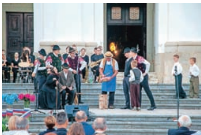
Prizor iz igre Cvetje v jeseni