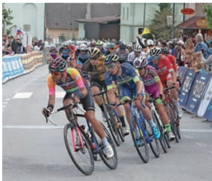
Dirka je potekala tudi skozi središče Cerklj.