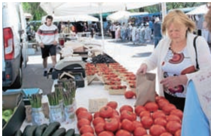
Na tržnici v Dvorjah

Na parkirnem prostoru pred Gostilnico in picerijo Pod Jenkovo lipo v Dvorjah pri Cerkljah že nekaj let vsakega enajstega v mesecu organizirajo tradicionalno in bogato založeno tržnico. Tržni prostor v Dvorjah v veliki meri privablja občane občine Cerklje in številne prebivalce okoliških krajev, ki cenijo zdravo, lokalno pridelano hrano višje kakovosti. Prodajalcem je na parkirnem prostoru na voljo od 16 do 20 stojnic. Tokrat so prišli v Dvorje prodajalci iz Metlike, Ribnice, Kočevja, Štajerske, Domžal, Kamnika in Zgornje Gorenjske. Lepo vreme je privabilo tudi številne kupce. Na tržnici so se predstavili tudi trgovci in obrtniki, ki so ponudili svoje izdelke. Tokrat so bili na voljo različno sadje, bučno olje, tekstilni izdelki, oblačila, spodnje perilo, obutev, suha roba in suhomesnati izdelki. J. Ku.