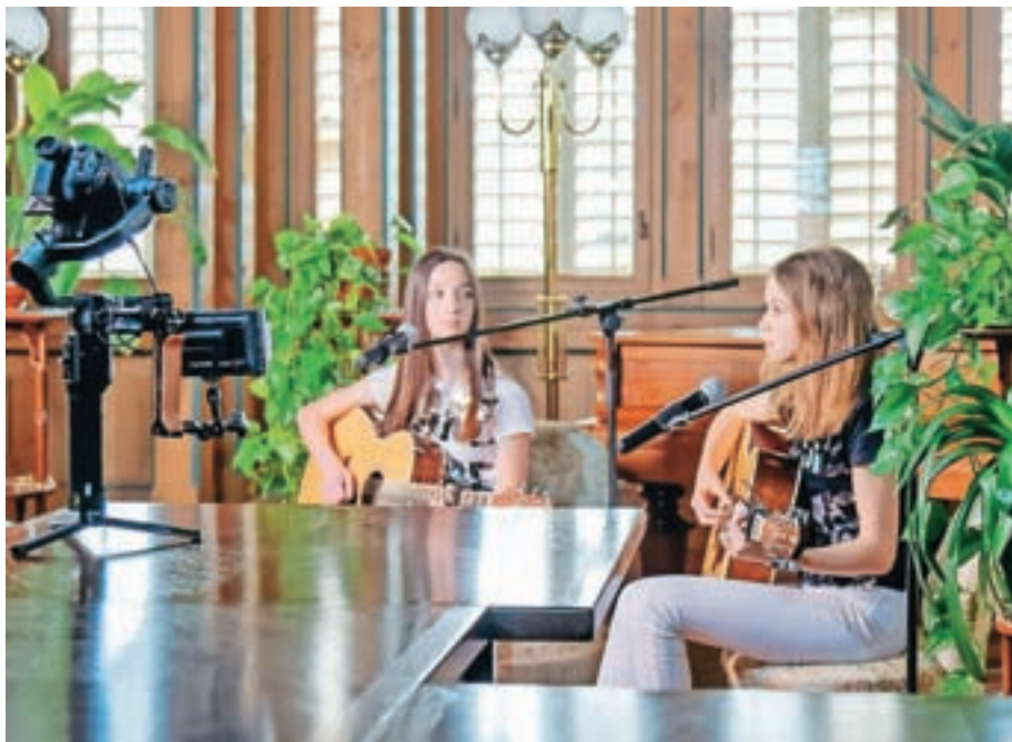
Koncert so nastopajoči vnaprej posneli v najimunitnejših stavbah cerkljanske občine – na gradu Strmol, v Hribarjevi vili in Petrovčevi hiši.