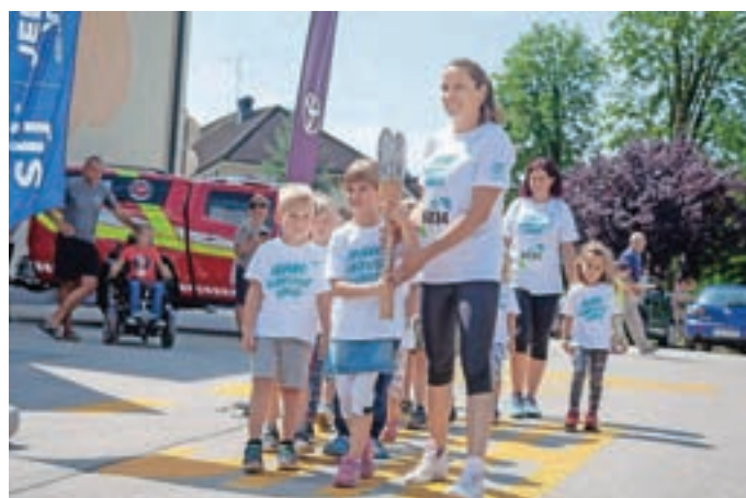
Otroci Vrtca Murenčki