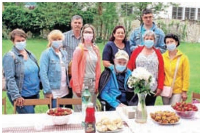
Skupina uporabnikov Centra Korak na obisku v Cerkljah