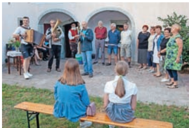
Večer Borštnikove poezije v organizaciji Folklorja Cerklje

Ignacij Borštnik je med Slovenci znan kot prvi slovenski poklicni igralec, a bil je tudi odličen pesnik, na kar so skupaj z gosti opozorili člani Kulturnega društva Folklorja Cerklje, ki so na vrtu pred Borštnikovo rojstno hišo v Cerkljah v začetku meseca pripravili recital njegove poezije. Zbrane so z besedo najprej popeljali skozi pester Borštnikov življenjepis. Kot igralec je namreč ustvaril več kot štiristo vlog, ustanovil in vodil je šole za gledališke igralce, napisal nekaj igrkazov in dramatiziral več del drugih avtorjev. S poezijo se je začel ukvarjati v poznejšem obdobju. Njegove pesmi pa razodevajo njegova čustvena stanja, obujajo spomine na mladost, izražajo domotožje, hrepenenje po domačih krajih ... Nekaj so jih prisotnim približali tudi recitatorji. Tako